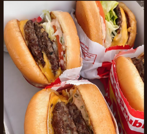
IN & OUT 明星汉堡