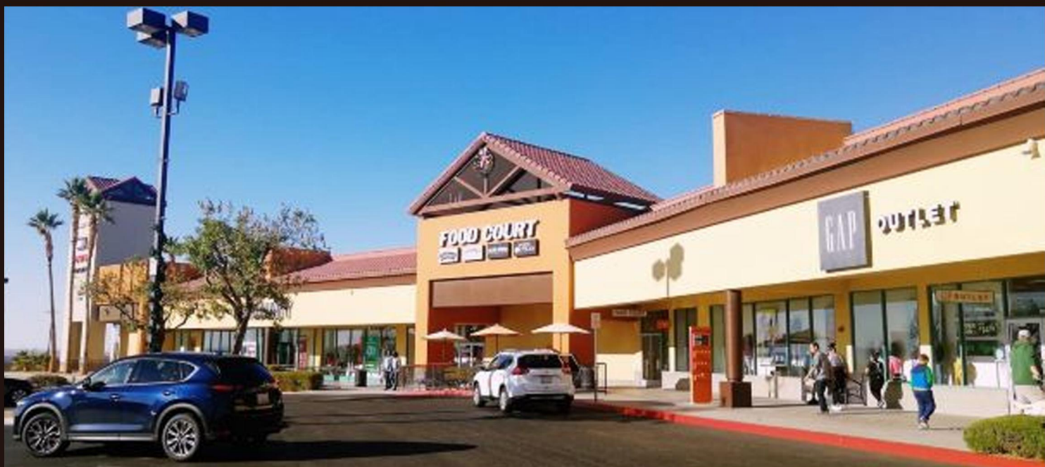
享世界名牌包包折上折