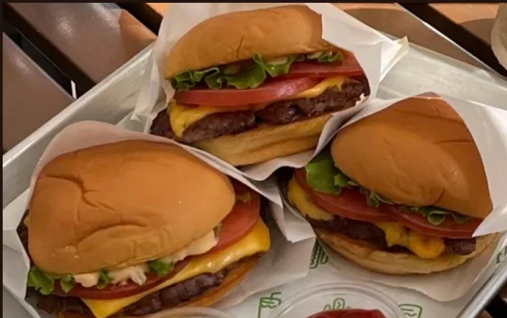
从热狗车到潮流图腾 解码Shake Shack汉堡帝国基因