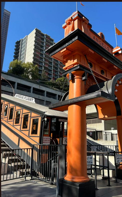
世界最短铁路：天使铁路