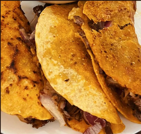
墨西哥风味玉米饼