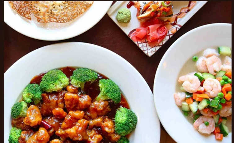
探访华盛顿的“议员餐厅” 皇朝饭店