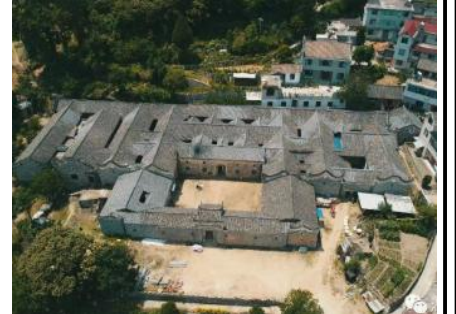
紫薇山庄 (车程 15 分钟)

温馨提示：报名时请您提供每位成人身份证号码及姓名，出行时请务必携带好每位成人的身份证件（小孩无身份证请携带户口本），住宿酒店需要出示身份证登记。