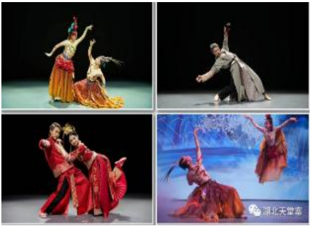
情恋·大别山 (车程 15 分钟)