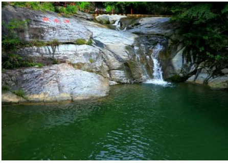
天堂寨神仙谷 (步行 2 分钟)