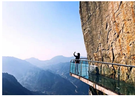
天堂寨玻璃栈道 (车程 10 分钟)