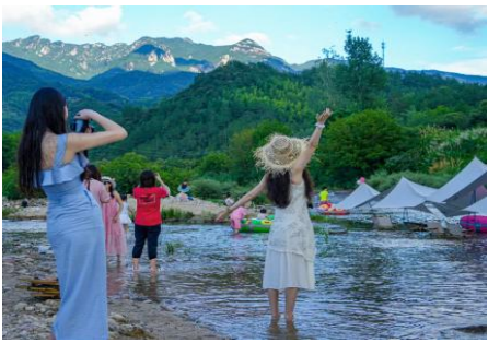
张家咀露营地 (车程 10 分钟)