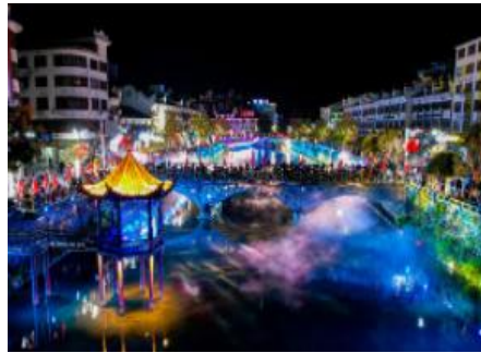
鸠兹古邑 (车程 15 分钟)