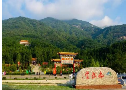
南武当 (车程 20 分钟)