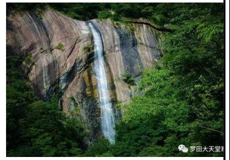
天堂大峡谷 (车程 15 分钟)