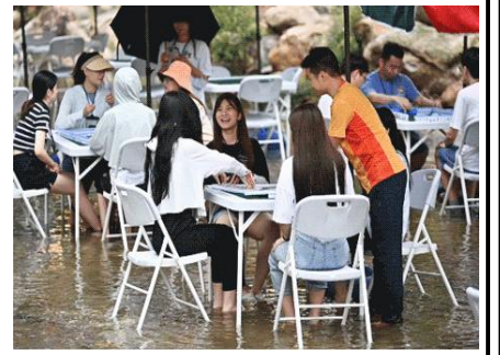
峡谷漂流·水上麻将 (车程 10 分钟)