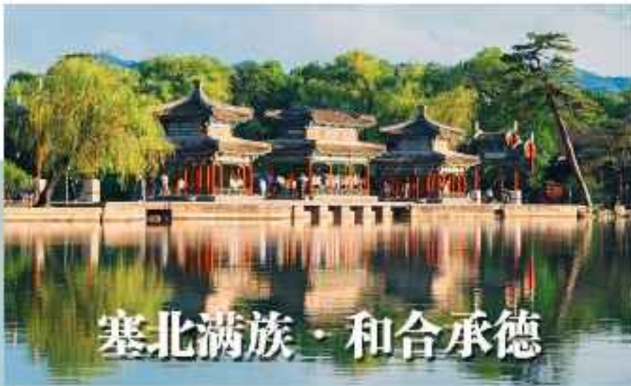
塞北满族·和合承德