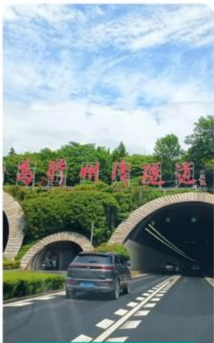
途径胶州湾海底隧道