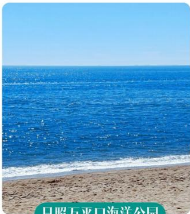
日照万平口海洋公园