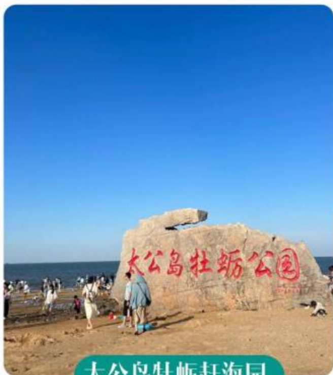
太公岛牡蛎赶海园