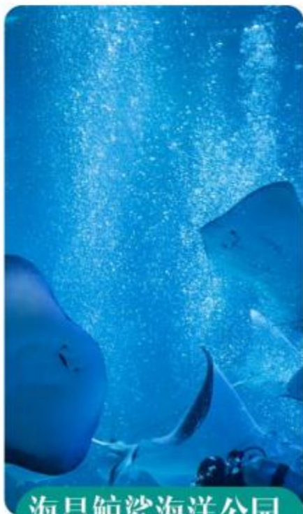
海昌鲸鲨海洋公园