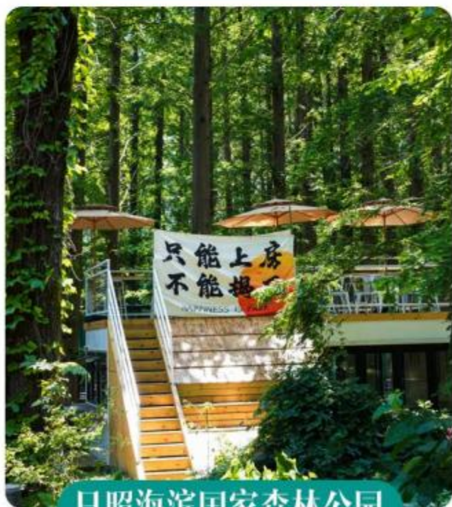
日照海滨国家森林公园