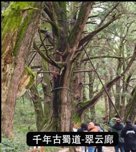
千年古蜀道-翠云廊