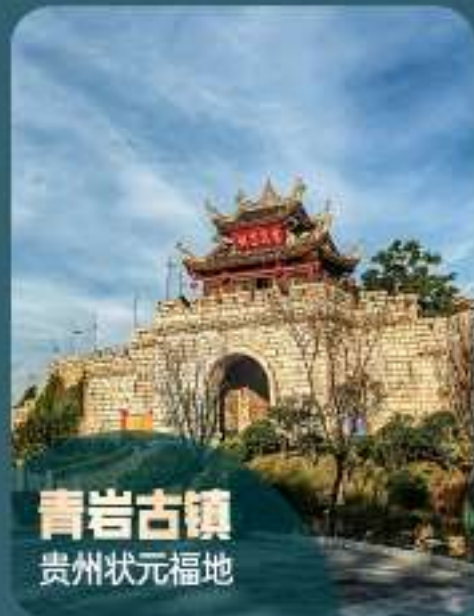
青岩古镇 贵州状元福地