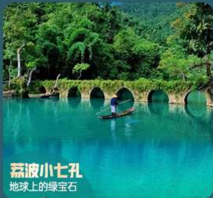
荔波小七孔 地球上的绿宝石