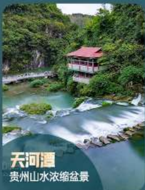
天河潭 贵州山水浓缩盆景