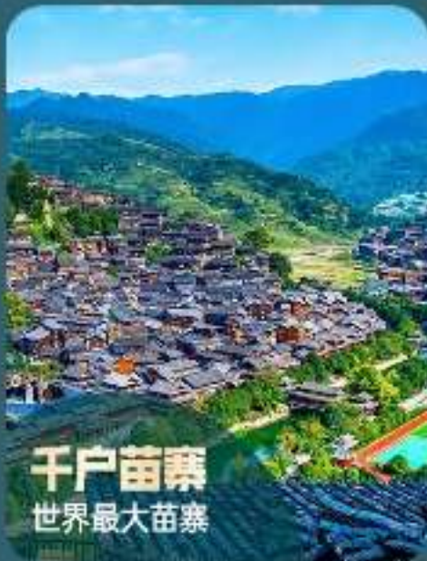
千户苗寨 世界最大苗寨