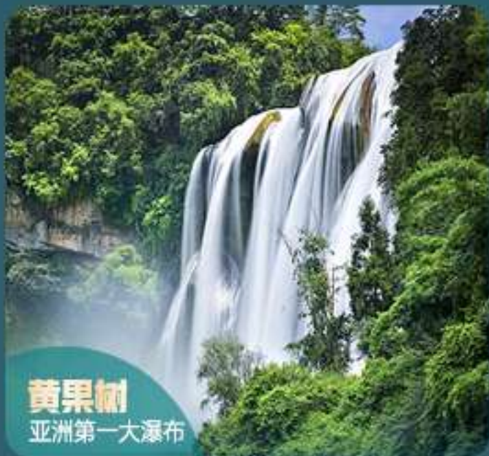
黄果树 亚洲第一大瀑布