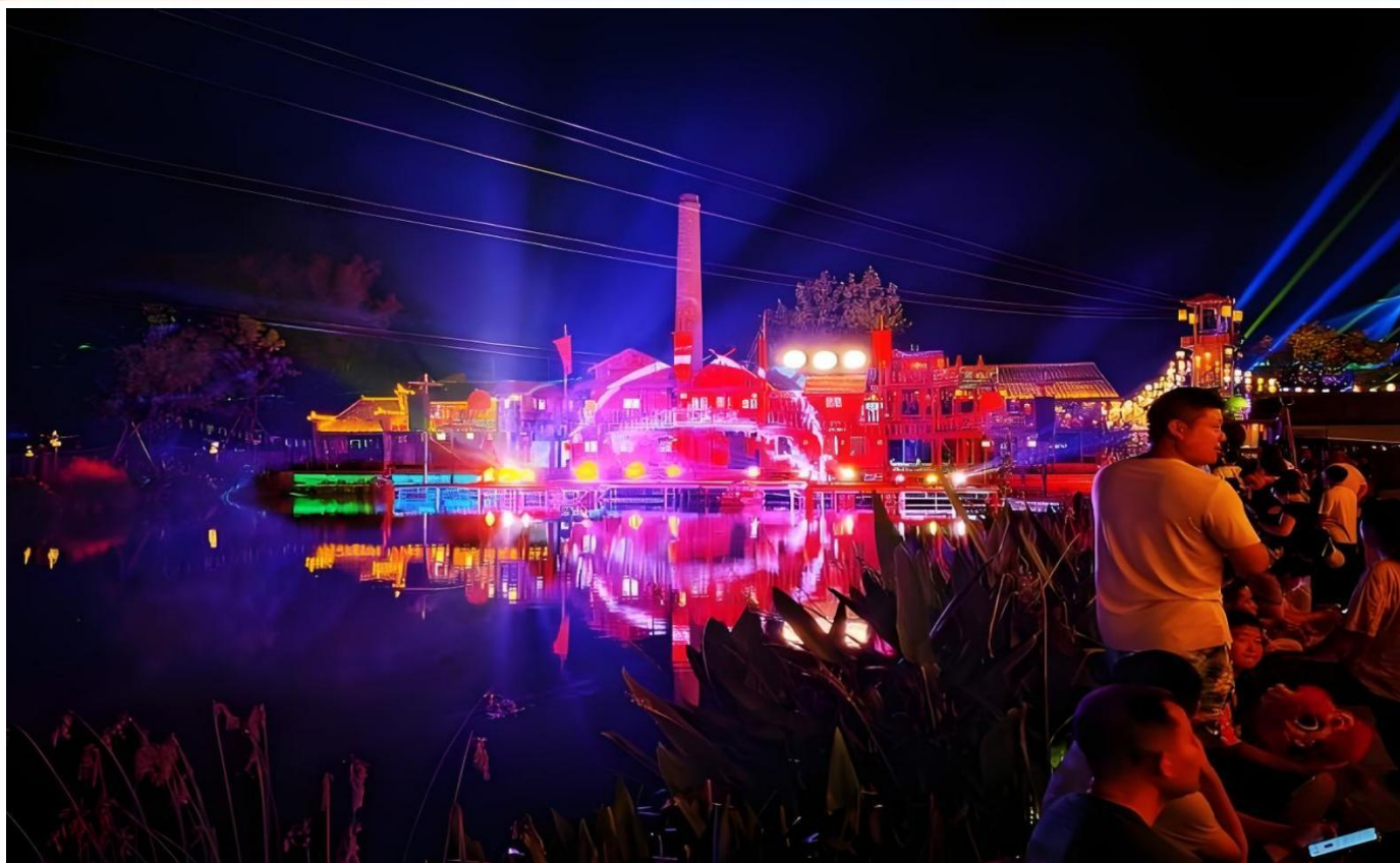
【 雉仙镇 】赏大型四幕实景剧——雉王传奇、打铁花、水爆、火爆、空中飞人特技表演、雉王巡游；