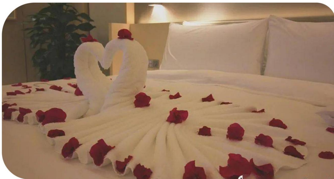
蜜月专享鲜花铺床&纯银对戒

Travel Ceremony · Customize a Gentle Encounter