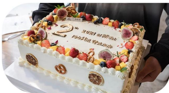
寿星专享生日蛋糕