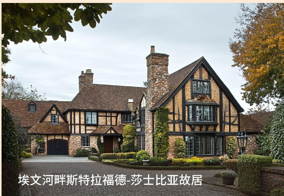
埃文河畔斯特拉福德-莎士比亚故居