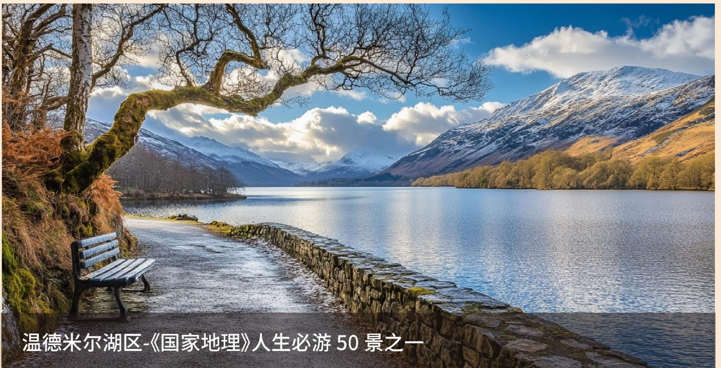
温德米尔湖区-《国家地理》人生必游 50 景之一