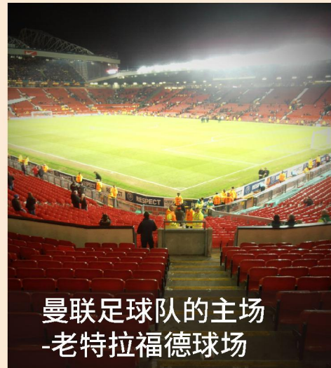
曼联足球队的主场 -老特拉福德球场