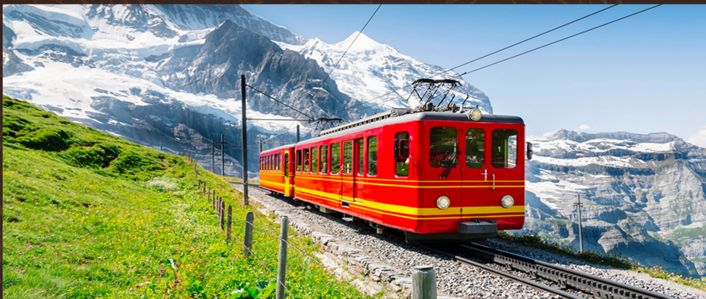
金色山口快车（一等座）