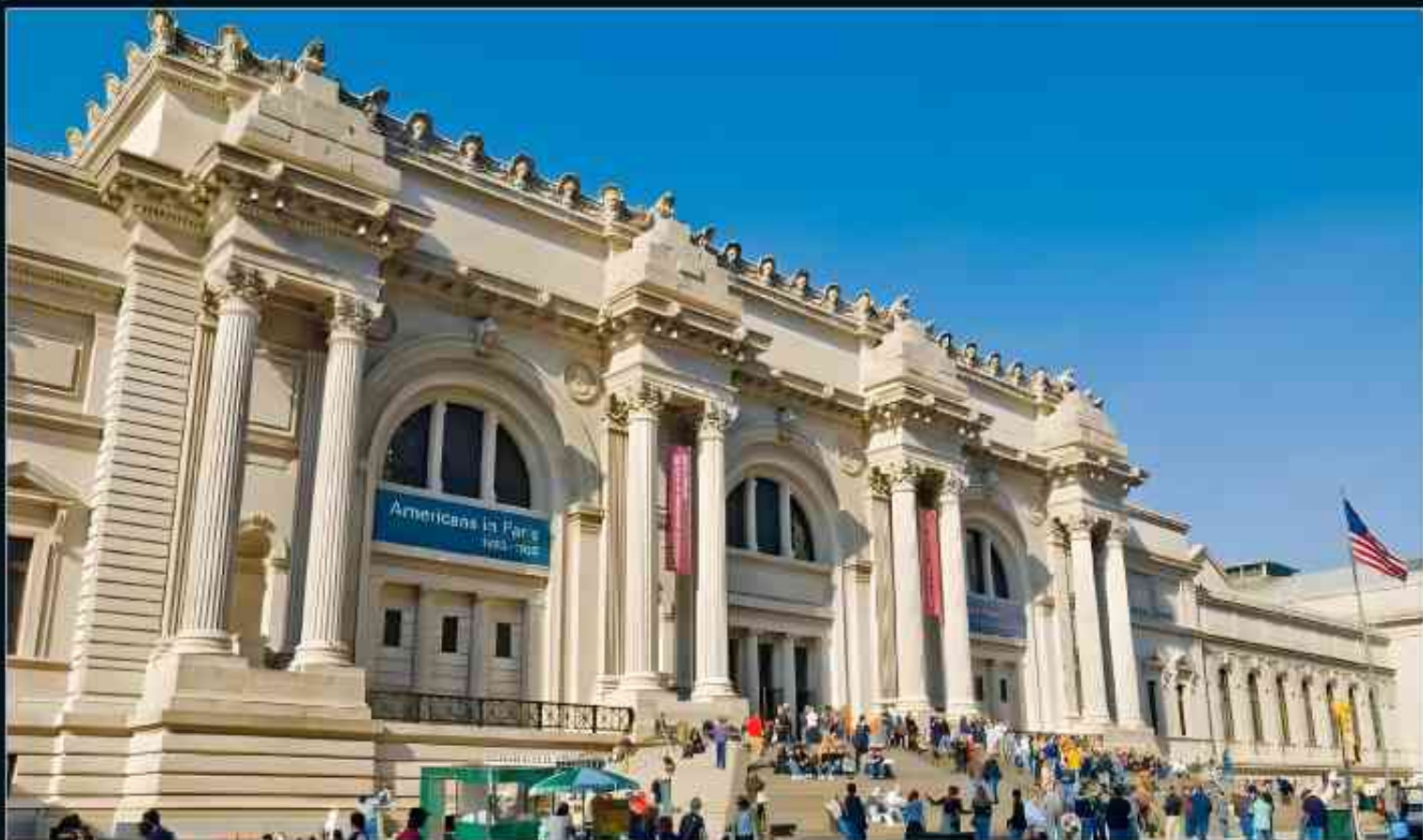
大都会博物馆探秘