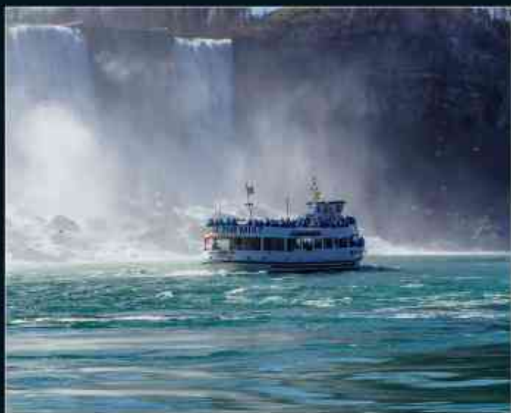
乘船0距离触摸震撼大瀑布