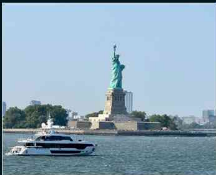
乘船游览自由女神 眺望布鲁克林大桥