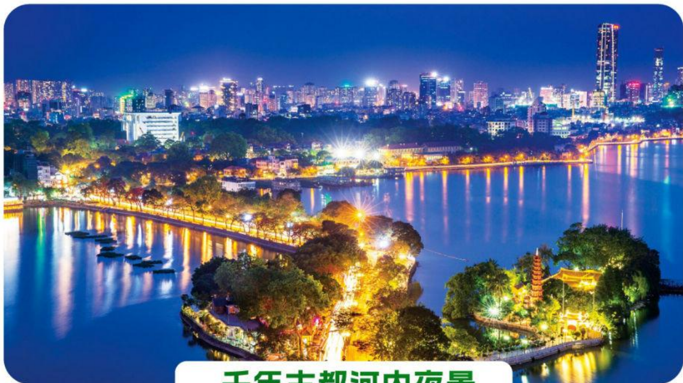
千年古都河内夜景