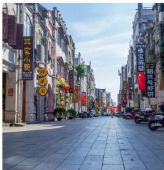
北海老街侨港风情街