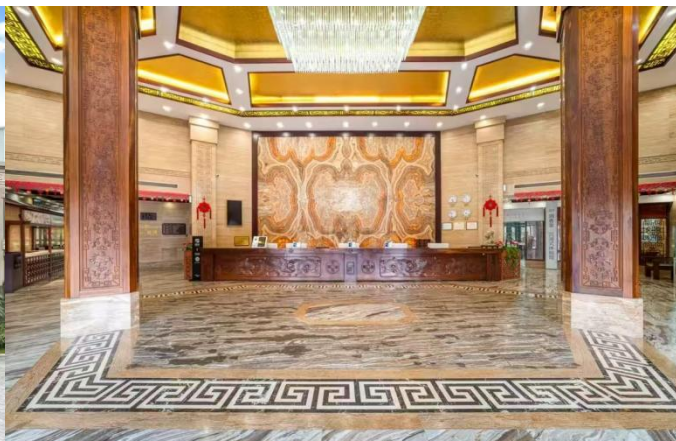
桂林段安排酒店：帝凯国际