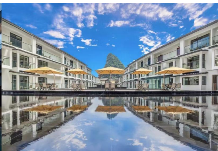
阳朔指定西街里最豪华酒店：漓境度假