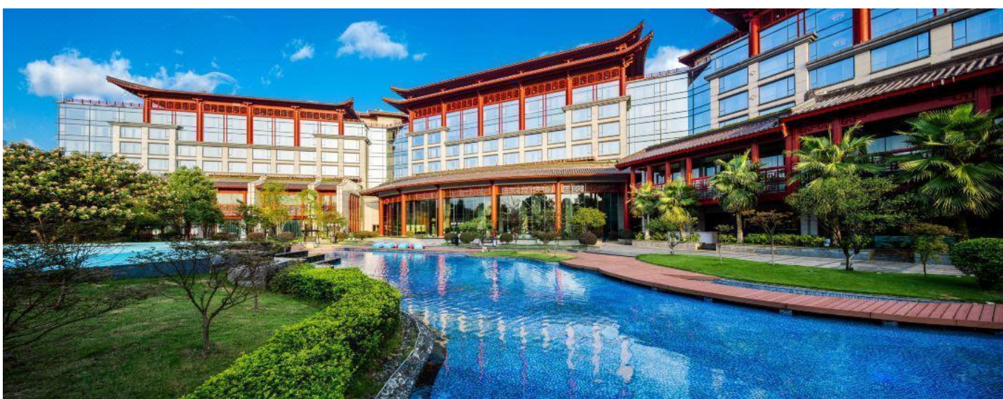
桂林升级一晚国际挂牌五星：香格里拉