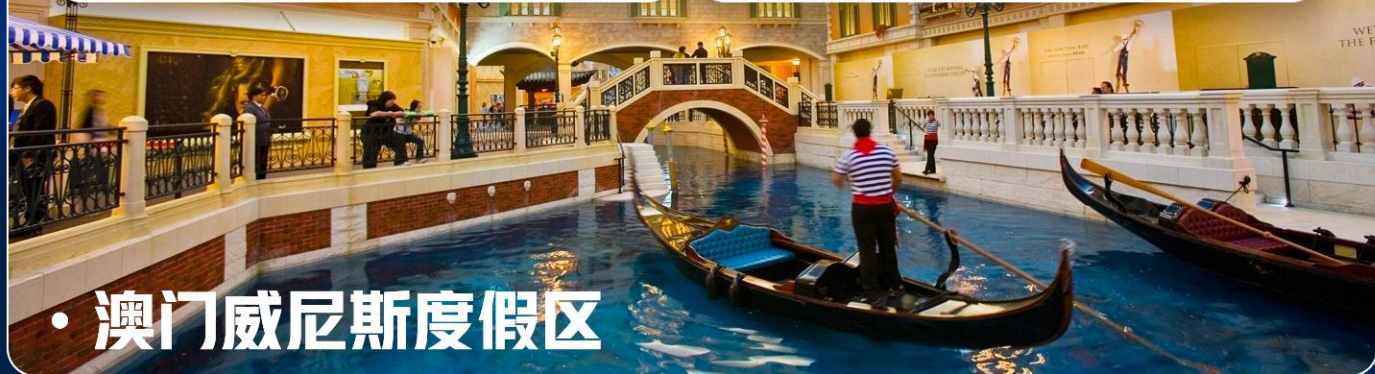
• 澳门威尼斯度假区