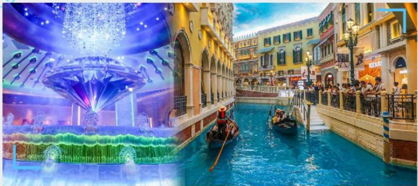
《银河钻石秀》、《威尼斯人度假村》