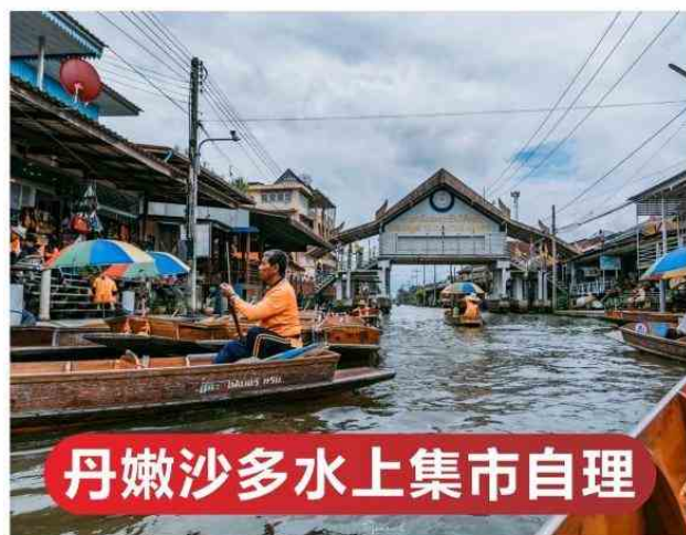
丹嫩沙多水上集市自理