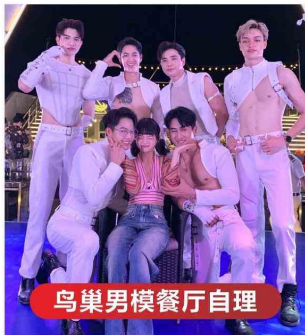
鸟巢男模餐厅自理