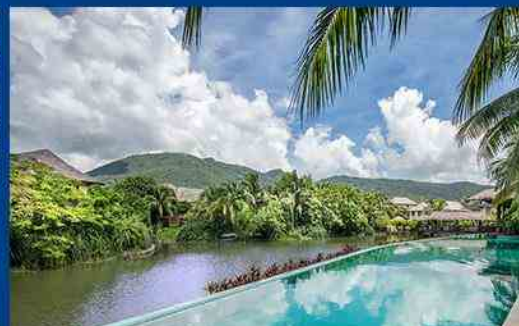
东南亚风格泳池别墅