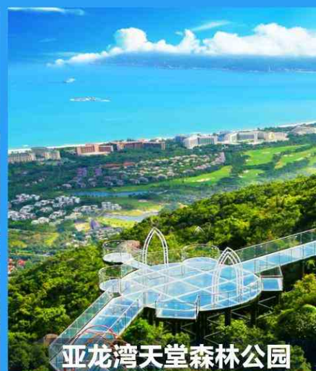
亚龙湾天堂森林公园