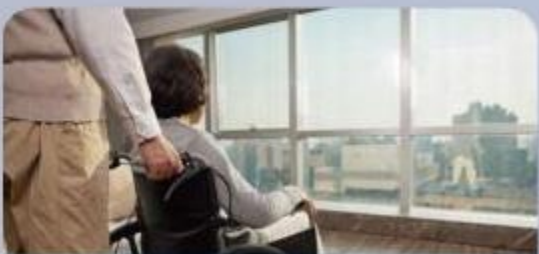
免费提供轮椅服务