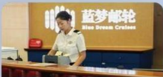
邮轮中文客服前台