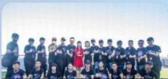
专业持证邮轮导游