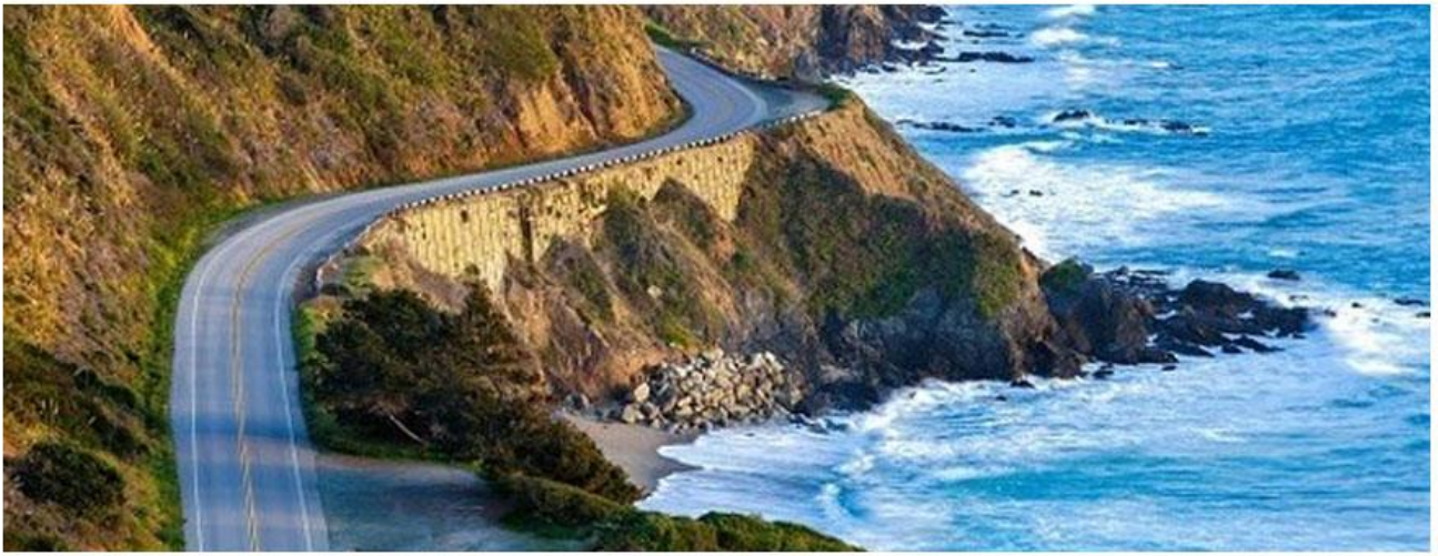
加州1号海滨公路，饱览太平洋旖旎风光