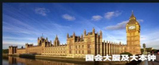
国会大厦及大本钟