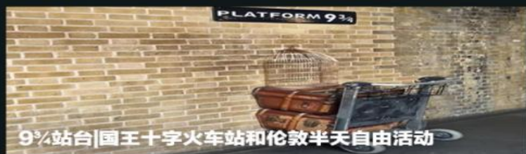
9¾站台|国王十字火车站和伦敦半天自由活动