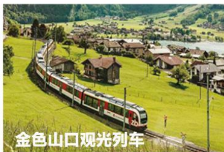
金色山口观光列车