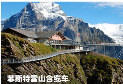
菲斯特雪山含缆车