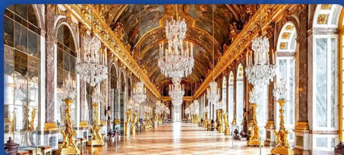
凡尔赛宫 (含人工讲解)