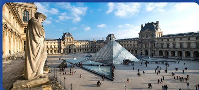
卢浮宫 (含人工讲解)

EUROPE, ALSO KNOWN AS "EUROPA" (GREEK: ΕΥΡΩΠΗ) EUROPE IS LOCATED IN THE NORTHWEST OF THE EASTERN HEMISPHERE, BORDERED BY THE ARCTIC OCEAN TO THE NORTH, THE ATLANTIC OCEAN TO THE WEST, AND THE MEDITERRANEAN AND BLACK SEAS TO THE SOUTH.