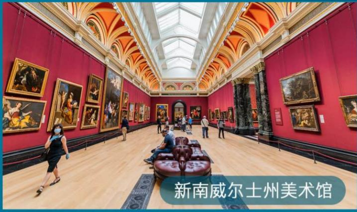
新南威尔士州美术馆