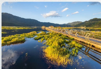
北海湿地（或银杏村）