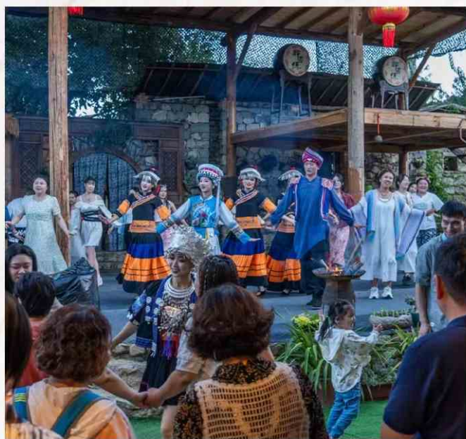
大型沉浸式主题演艺 《马帮江湖》