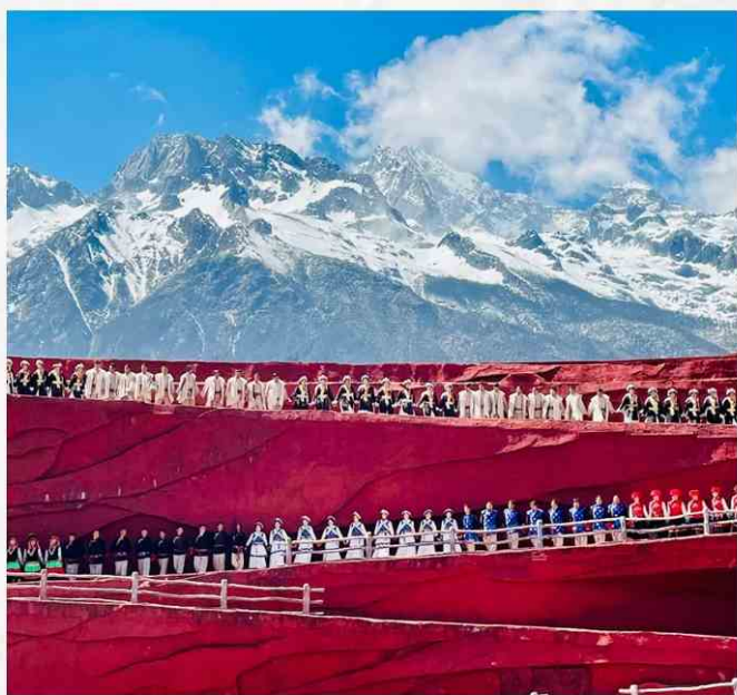
大型原生态的震撼表演 《印象丽江》