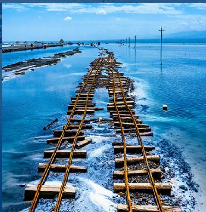
➤ 茶卡盐湖 茶卡壹号·盐湖景区