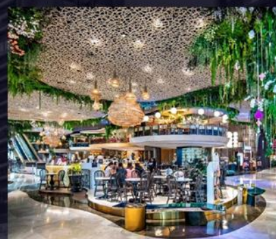
7大餐饮美食区 FOOD COURT