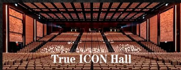
True ICON Hall