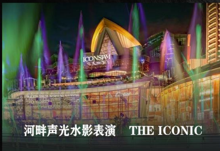
河畔声光水影表演 THE ICONIC