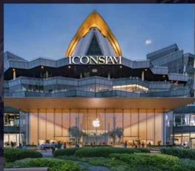
暹罗天地公园 ICONSIAM PARK