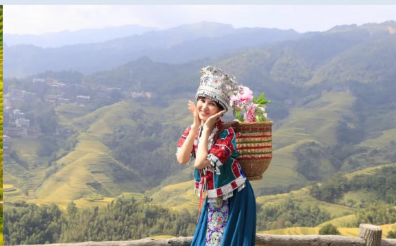
龙脊梯田——观赏世界一绝