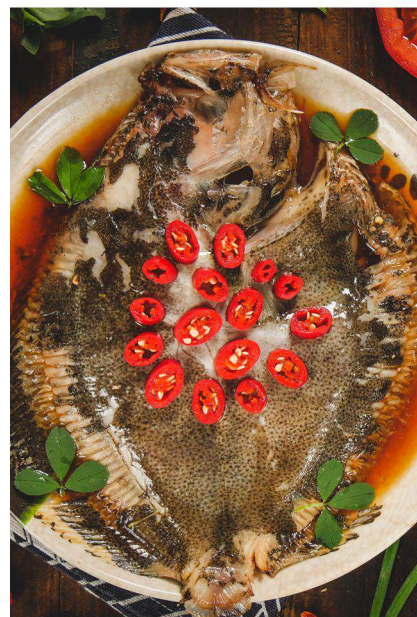
王家味窑餐厅 清蒸多宝鱼