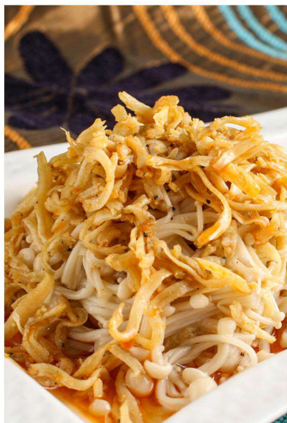
开封特色包子宴 丁香鱼