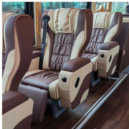
每座配备两个充电口 TWO CHARGING PORTS