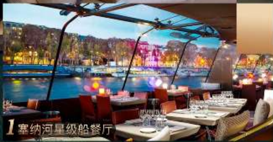
1 塞纳河星级船餐厅