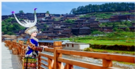
西江千户苗寨·夜景·长桌宴